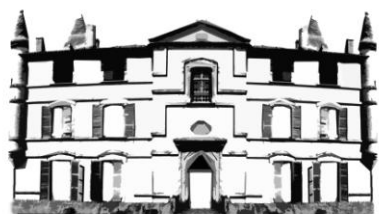
CHÂTEAU DE BONREPOS-RIQUET

Château de Bonrepos-Riquet En Mairie 31590 BONREPOS-RIQUET