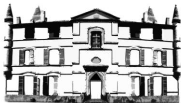
CHÂTEAU DE BONREPOS-RIQUET

Château de Bonrepos-Riquet En Mairie 31590 BONREPOS-RIQUET