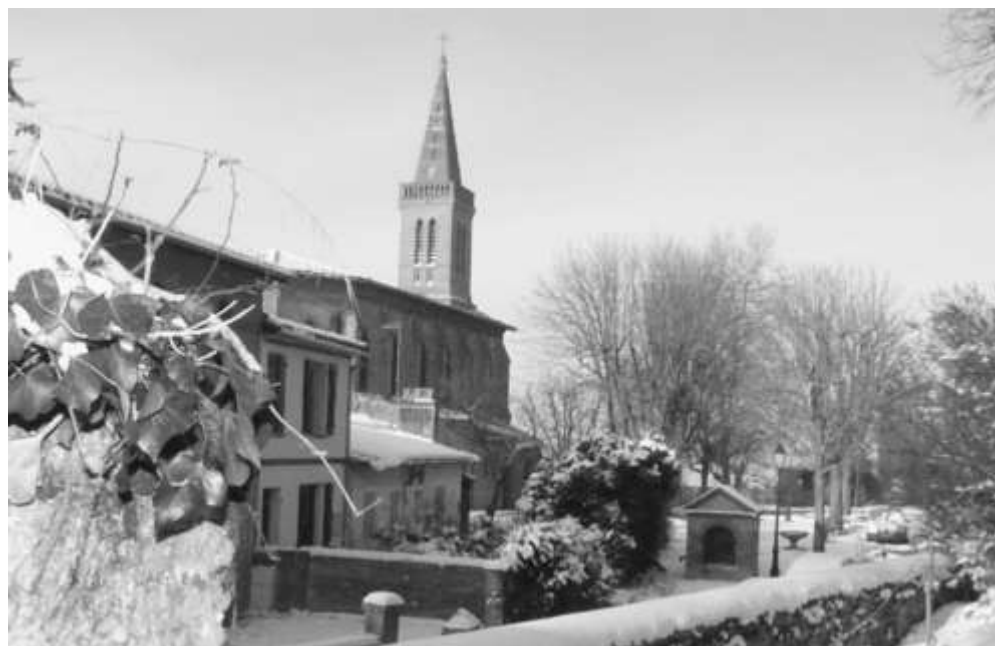
Bonrepos-Riquet sous la neige Hiver 2009-2010